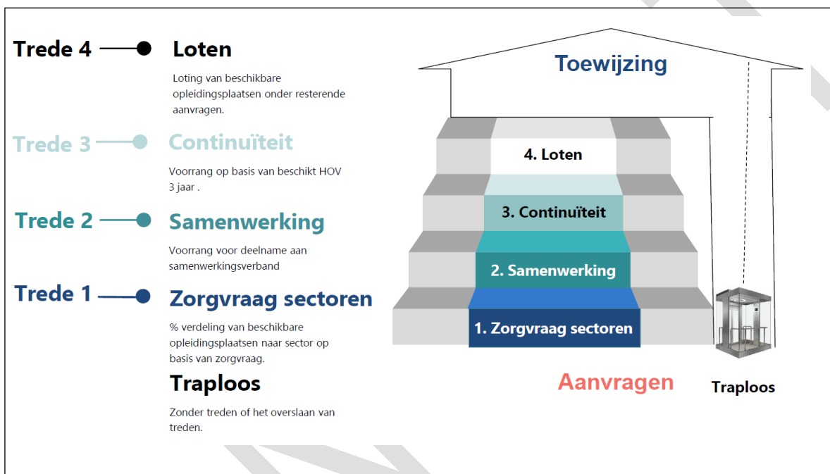
Figuur 2: getrapte toewijzingssystematiek

Voor de toewijzing voor 2024 zal gebruik worden gemaakt van een getrapte toewijzingssysteem, zoals hieronder schematisch wordt weergegeven.