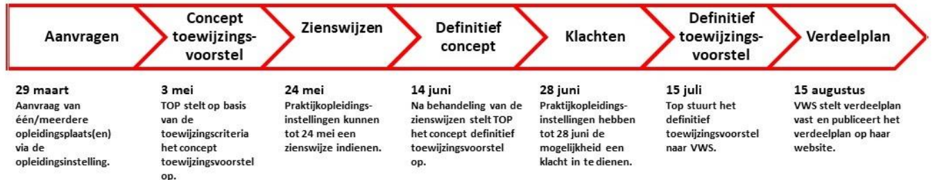
Figuur 1: Tijdpad toewijzingsproces 2025