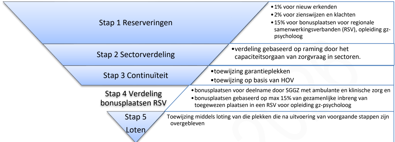
Figuur 2: Verdeelstappen voor toewijzing van subsidieplaatsen

Het onderstaand schema geeft de stappen in het toewijzingsproces weer. De gedetailleerde toepassing vindt u in hoofdstuk 3.